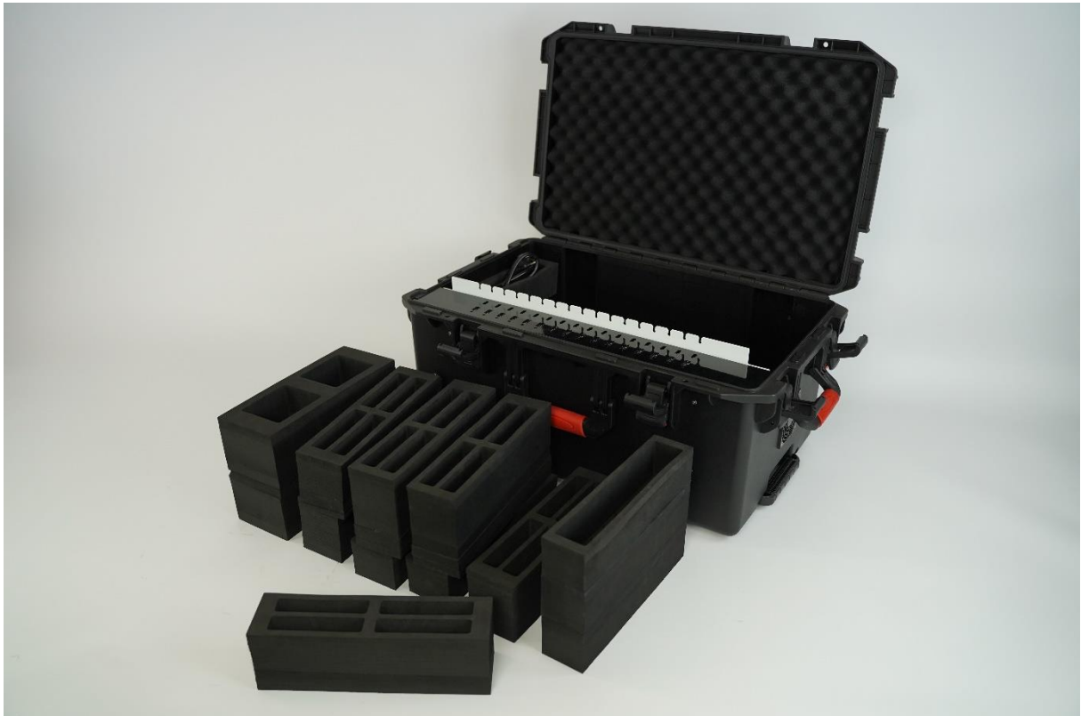
12990-01 Aufbewahrungsblock 1 „kleine Sensoren“